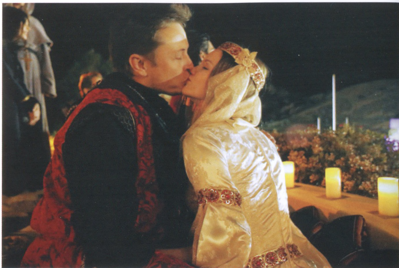
Маск женился на актрисе Талуле Райли, развелся с ней, снова женился на ней и опять развелся.