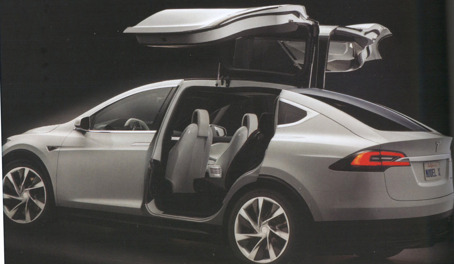
Следующей машиной Tesla станет Model X SUV с фирменными дверями «крыло сокола».