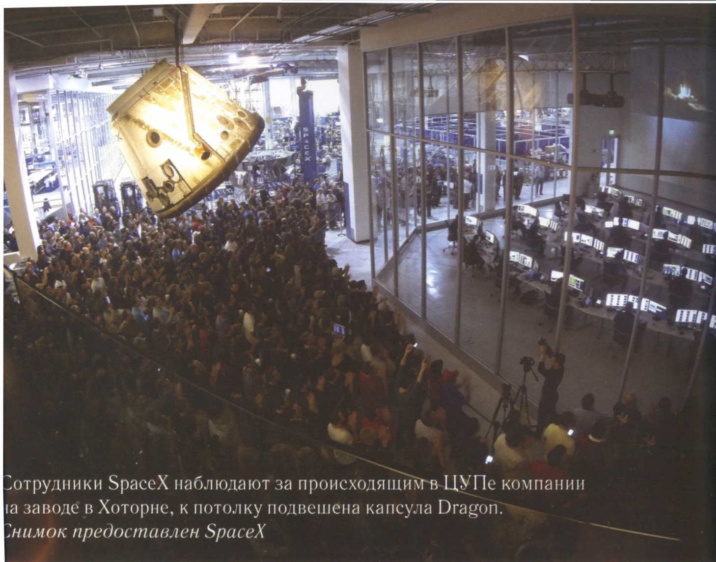
Сотрудники SpaceX наблюдают за происходящим в ЦУПе компании на заводе в Хоторне, к потолку подвешена капсула Dragon.