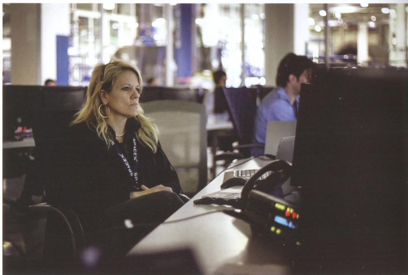
Гвинн Шотвелл — правая рука Маска в SpaceX, она управляет ежедневным рабочим ритмом компании и наблюдает за запусками из ЦУПа.