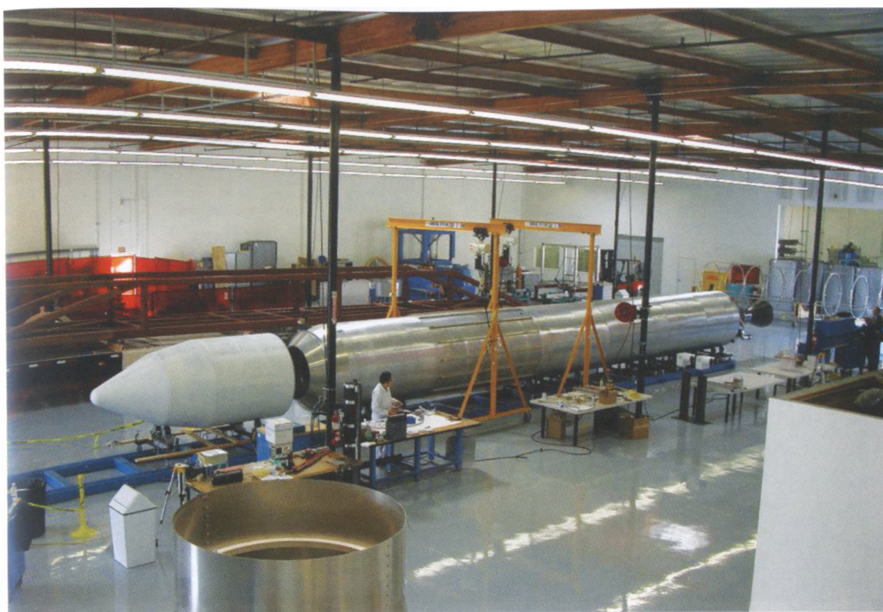
Сборка ракеты Falcon 1 на ракетном заводе, созданном SpaceX в бывшем авиазаводе в Лос-Анджелесе.