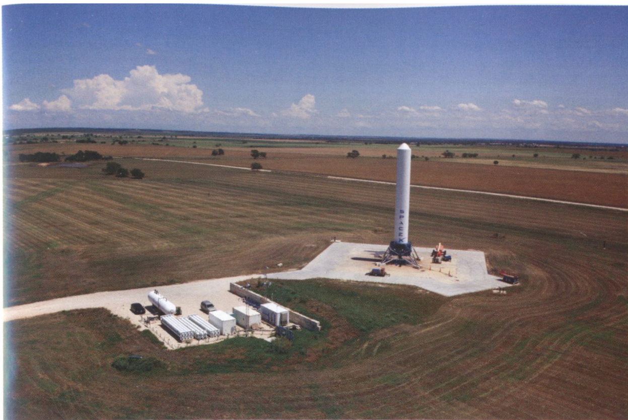
SpaceX испытывает новые двигатели и аппараты в Макгрегоре (штат Техас). На снимке — испытания ракеты многоразового использования под кодовым названием «Кузнечик» (Grasshopper), которая будет способна приземляться.