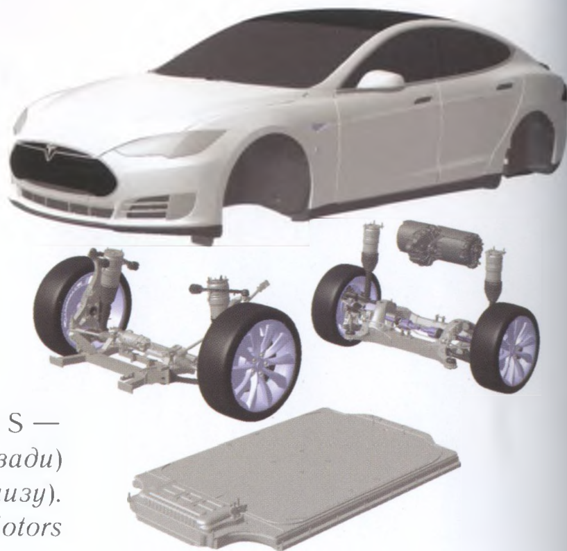
Разобранный седан Tesla Model S — видны электромотор (сзади) и батарейный блок (внизу).