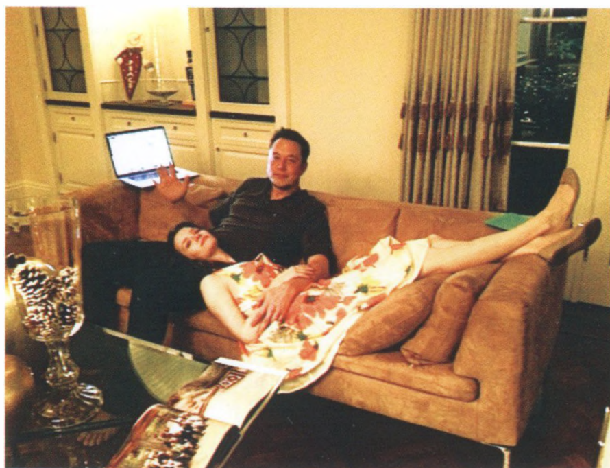
Маск и Райли отдыхают у себя дома в Лос-Анджелесе. С Маском живут пятеро его сыновей.